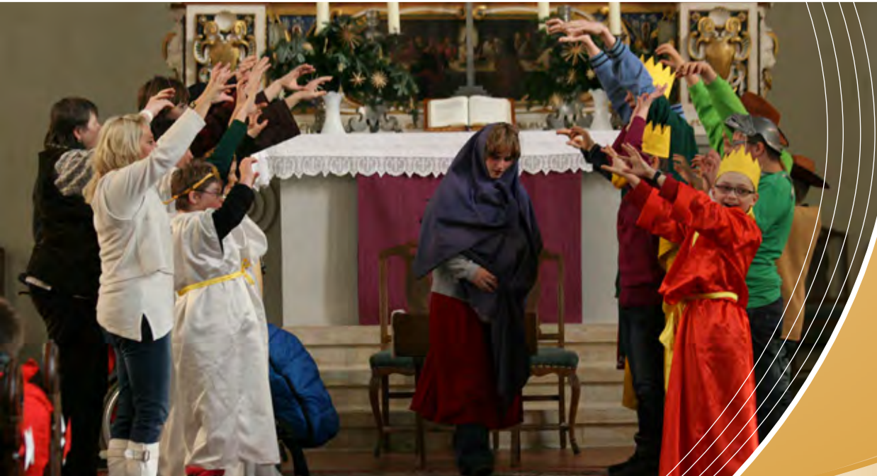
Krippenspiel der Förderschule

Evangelisch-Lutherische Landeskirche Sachsens