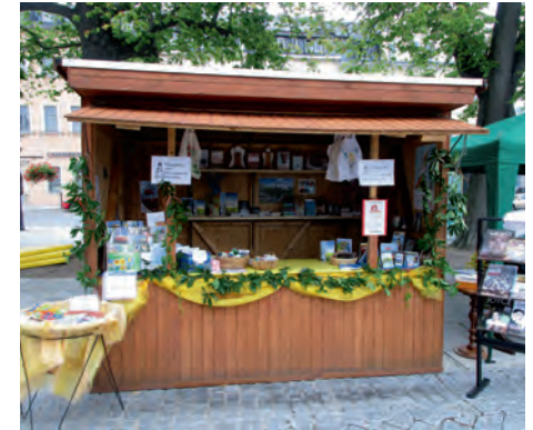
Unser Stand auf dem Markt

Nach einem gelungenen „Gemeindefest der anderen Art“ auf dem Holzmarkt der Stadt Marienberg möchten wir uns bei allen bedanken, die daran beteiligt waren. Viele Helfer und fleißige Hände haben stundenlang gebastelt, geräumt, verkauft, Gespräche geführt, Führungen durch die Kirche und auf den Turm gemacht und wertvolle Ideen eingebracht.