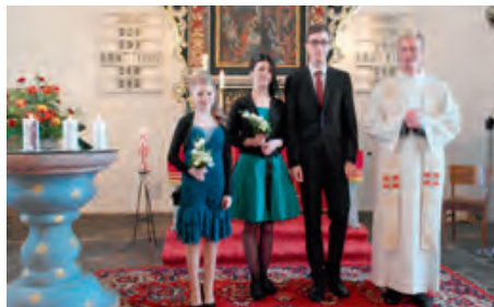
Konfirmanden aus Satzung