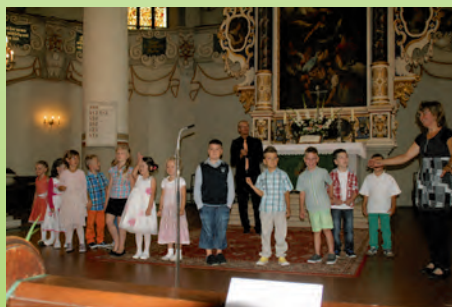
Die Schulanfängerandacht am 24. August in St. Marien