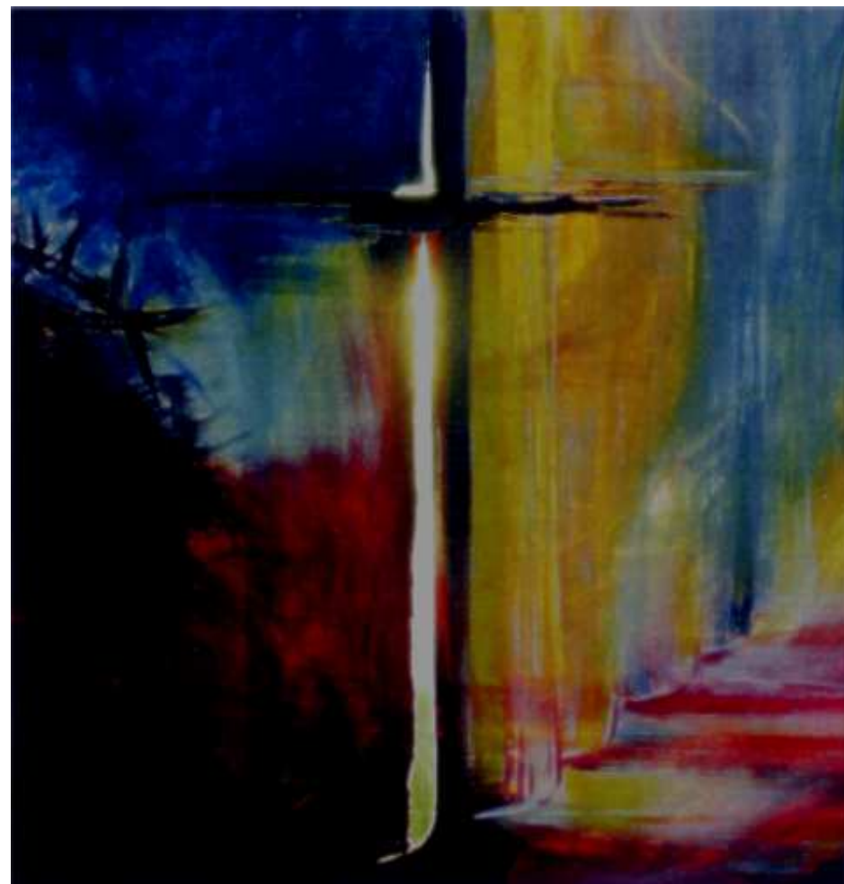
© Elke Frommhold, „Der zerrissene Vorhang“

Gemeindebrief der Ev.-Luth. Kirchgemeinde Marienberg April und Mai 2012