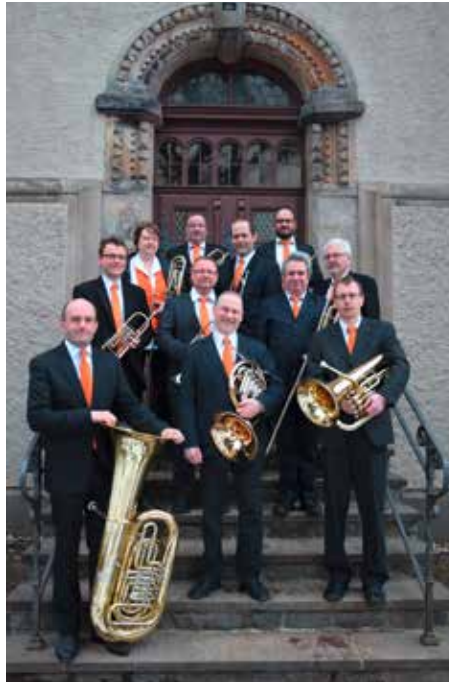
25 Jahre Ephoraler Bläserkreis

Förderverein: www.foerderverein.kirche-marienberg.de