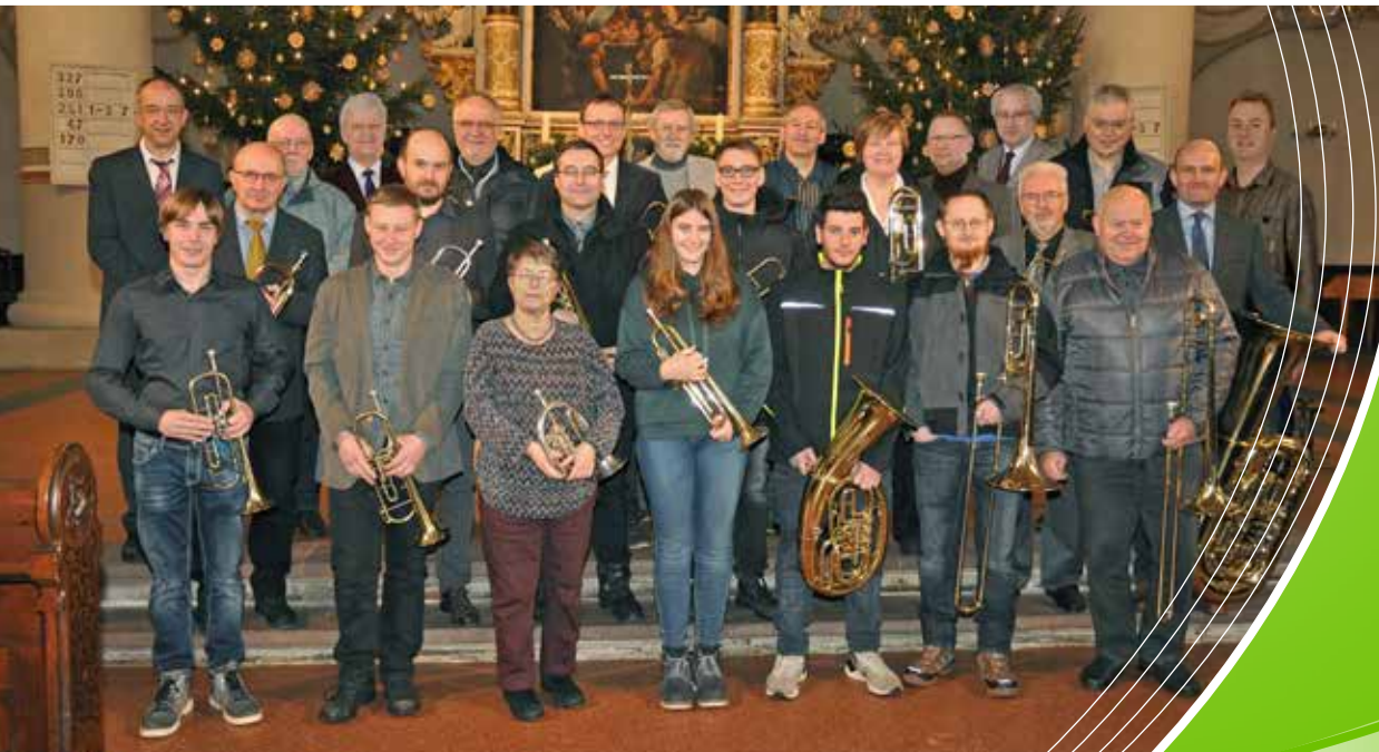
Posaunenchor Marienberg 2019

Evangelisch-Lutherische Landeskirche Sachsens