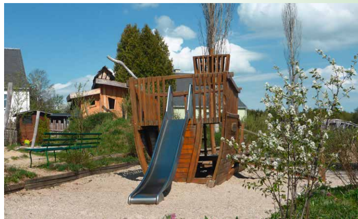
Kindergarten St. Marien